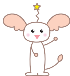
びぶれキャラクター び〜