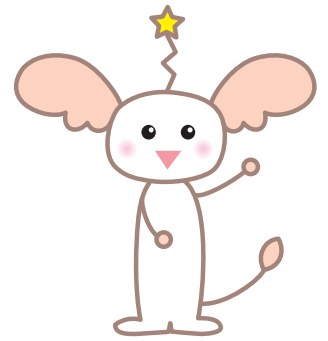
びぶれキャラクター び〜