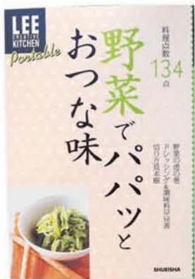
野菜でパパッとおつまみ 生活文化編集部編

来春のNHK朝ドラ「ゲゲゲの女房」が話題の水木しげる。ここには貸本作品から超レア作品まで、オール読み切り14話が詰まっています。(ホーム社・880円)