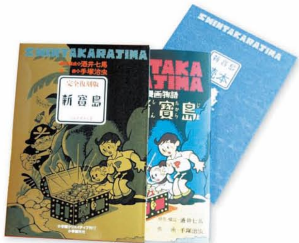
完全復刻版 新寶島 手塚治虫

1冊の本から学ぶことは数多くあります。 ここでは団塊の世代にぴったりの本を紹介します。