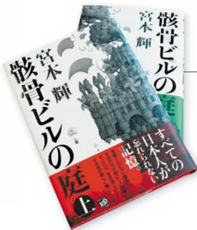
骸骨ビルの庭(上・下) 宮本輝

生誕100年として再び注目を集めている松本清張。本作品は東京・蒲田駅の操車場で発見された男の死体から物語が始まる、本格的推理長編小説です。(新潮文庫・上巻660円、下巻700円)