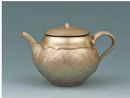
内田鋼一「白金彩線刻文後手茶注」2014年